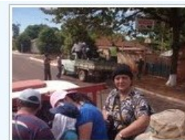
CAMINHÃO INDO PRA ALDEIA